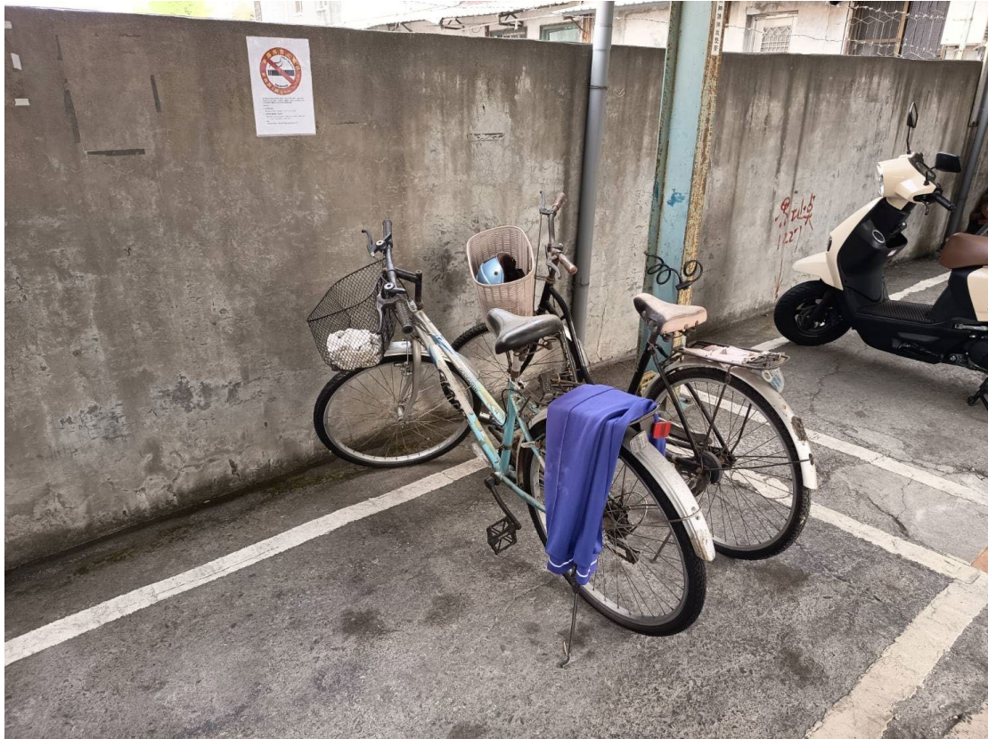
棄置腳踏車兩輛照片